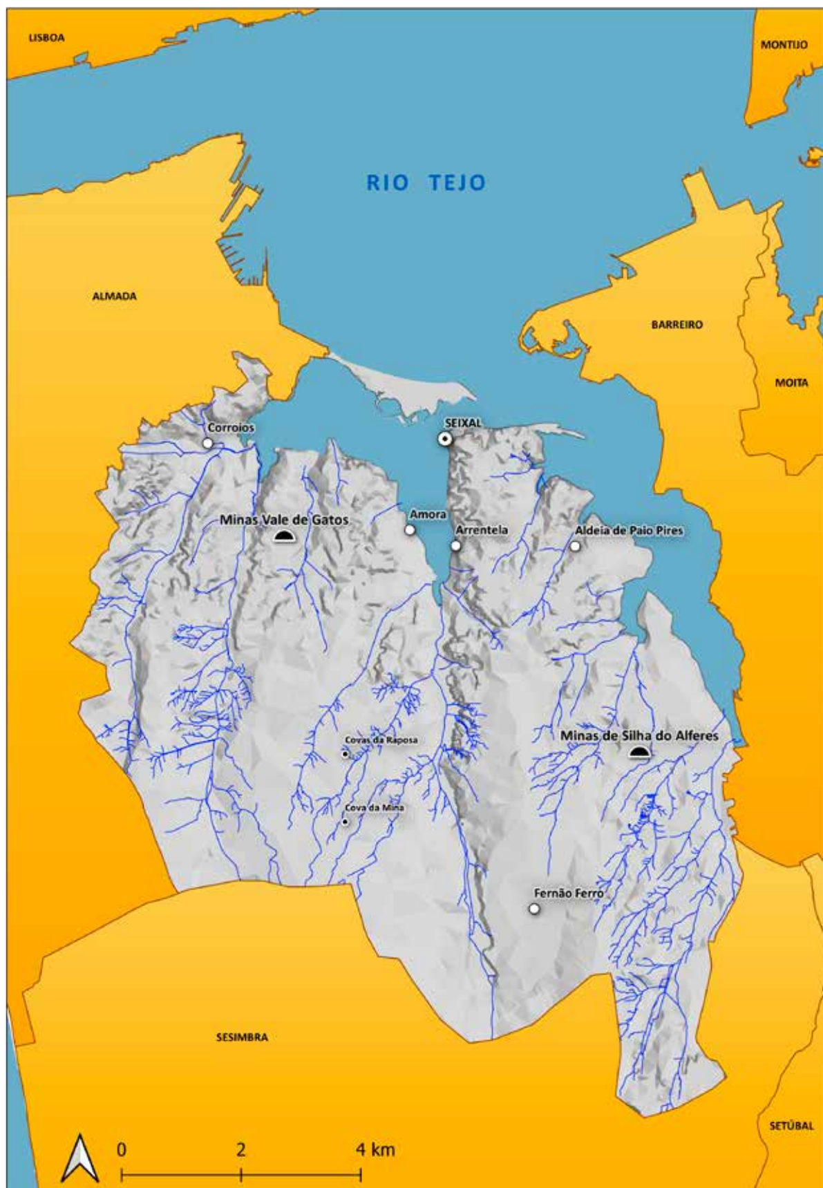
FIG. 1 Território do Seixal e dos municípios envolventes, com sinalização dos núcleos de galerias de Vale de Gatos (Corroios) e Silha do Alferes (Foros da Catrapona). Base cartográfica em suporte QGIS: Cézer Santos.