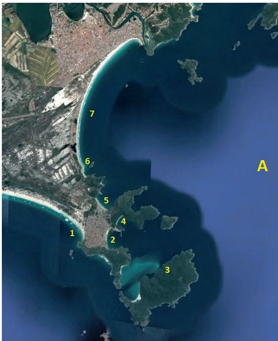
Figura 3 – Localização de pescarias no litoral entre a restinga de Massambaba e a Ponta de Búzios em 1729

A: Trecho litorâneo entre a Restinga de Massambaba e barra de Cabo Frio (Itajurú)