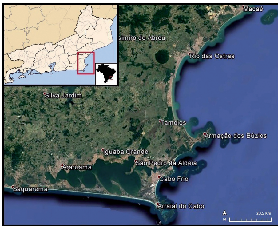
Figura 1 – Localização da área de estudo

A área objeto deste estudo localiza-se na região das baixadas litorâneas do estado do Rio de Janeiro (figura 1). Constituída por uma planície sedimentar de baixa altitude, esta região é caracterizada pela presença de vários sistemas lagunares costeiros, cujo confinamento se deveu à formação de um conjunto de restingas duplas 3 .