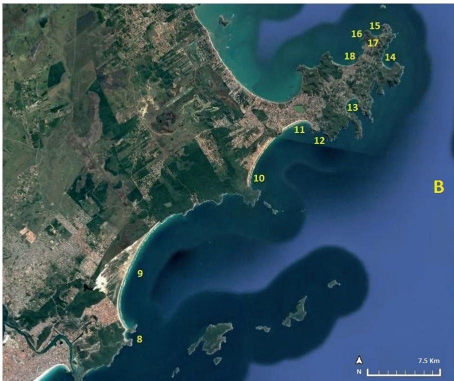
B: Trecho litorâneo entre a barra de Cabo Frio (Itajurú) e a Ponta de Búzios

8 – Praia Brava ou Vermelha; 9 – Praia do Peró; 10 – Praia da Emerência; 11 – Praia de Jerubá; 12 – Praia da Ferradurinha; 13 – Praia da Ferradura Grande; 14 – Praia Brava; 15 – Praia de João Fernandes; 16 – Praia da Sardinha; 17 – Praia do Maribondo; 18 – Praia da pescaria dos Índios.